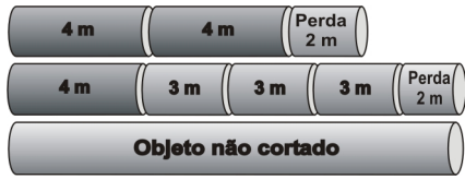
Figura 3: Padrões de corte para a Solução 1.