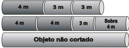
Figura 4: Padrões de corte para a Solução 2.

Considerando a função objetivo perda total , as duas soluções apresentadas são equivalentes, pois apresentam uma perda total de 4 metros, porém, para o problema de reaproveitamento, a Solução 2 (Figura 4) é preferível a Solução 1 (Figura 3), visto que concentra as perdas em um único objeto e, como ela é superior a 3 metros, torna-se uma sobra que poderá voltar ao estoque para atender futuras demandas. Na Solução 1, como as perdas são inferiores a 3 metros, serão descartadas. Para o problema de reaproveitamento das sobras de material, a Solução 1 é considerada indesejável , enquanto que a Solução 2 é ideal .