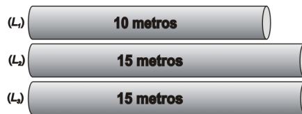
Figura 1: Dados dos objetos em estoque.

Para uma melhor compreensão do problema de corte de estoque com reaproveitamento das sobras de material, considere o seguinte exemplo, em que sobra é todo pedaço de comprimento superior ou igual a 3 metros (o tamanho da sobra pode ser, por exemplo, o comprimento do maior ou menor item demandado).